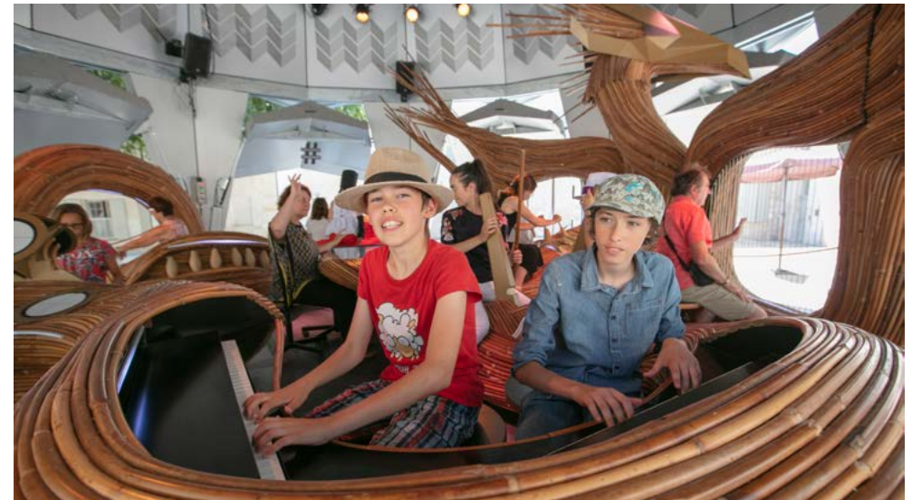
À l'intérieur du carrousel