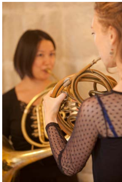
Le JOA en répétition