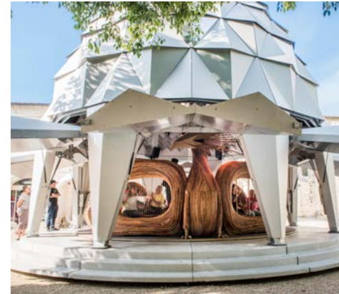
Le Carrousel Musical