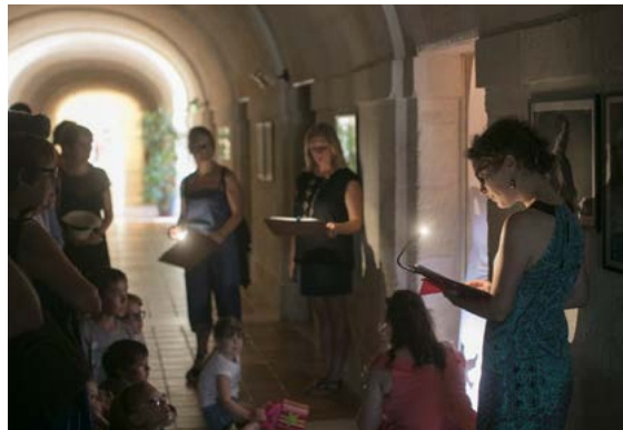
Visite en ombres chinoises