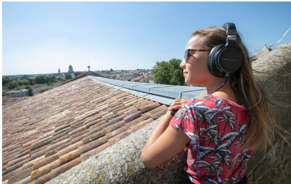
Le Voyage Héroïque

Carrousel Musical ouvert - couplez votre expérience!