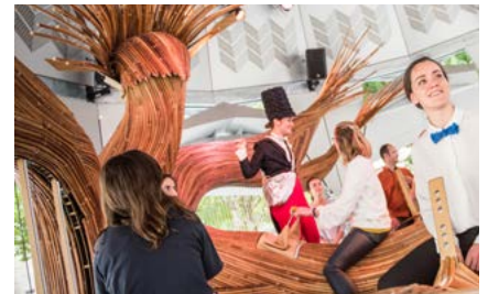
Le Carrousel Musical