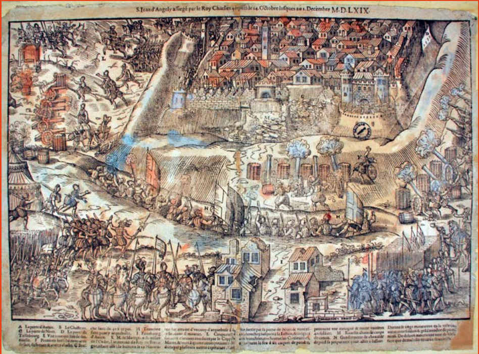
Conception graphique: Abbaye aux Dames. Ne pas jeter sur la voie publique.