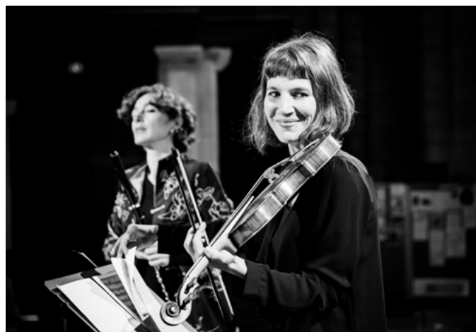
Les Surprises