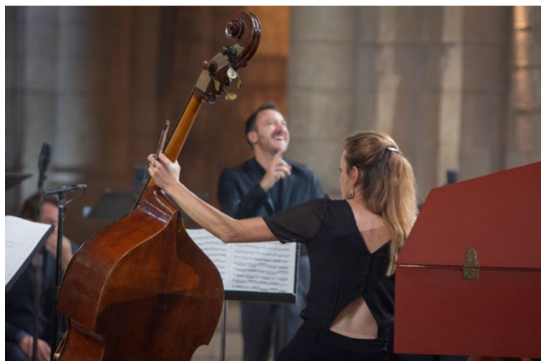
Le Banquet Céleste