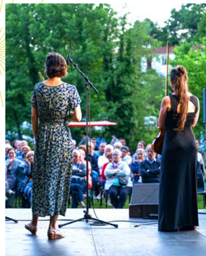
Trio Zerline

Abbaye aux Dames la cité musicale, Saintes