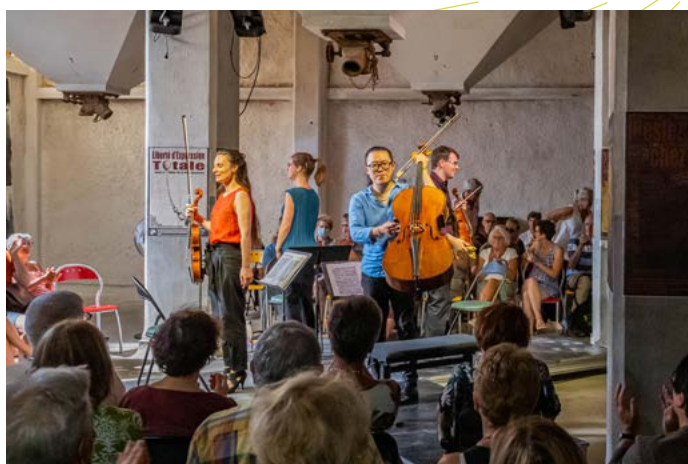
Girandola quartet

chemin@abbayeauxdames.org avant le 20 décembre 2022