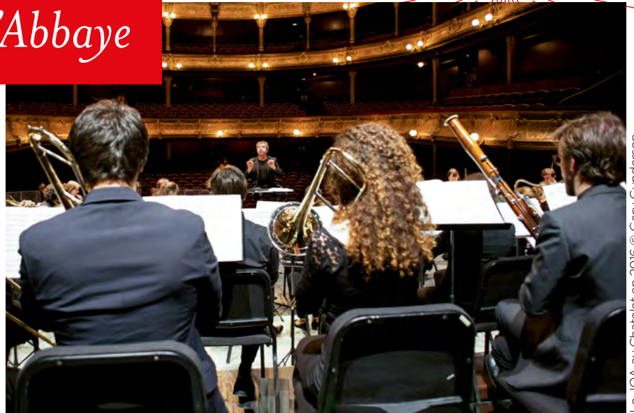
Le JOA au Chatelet en 2016

Base de négociation: 10 000€ + HR si nécessaire (voyage et technique inclus)