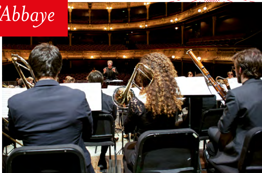
Le JOA au Chatelet en 2016